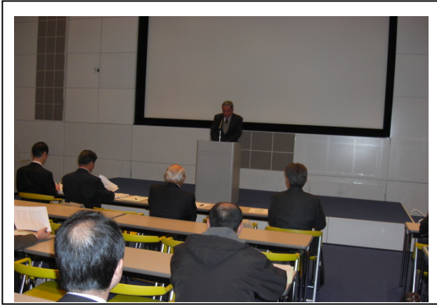
(社) 岐阜県工業会 河合技術交流委員会委員長 開会挨拶